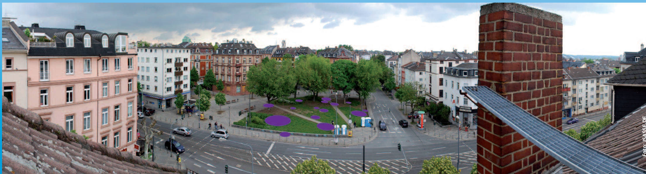
Der Friedberger Platz